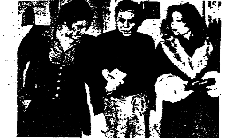
مدرسة المتأهبين نص جديد واخراج جديد

وتقول دراسة بهذا المعنى اعدها عدد من العلماء الاكبرين ان عملية الحب تبقى من الامور التي لا تقع بمجرد لحظة اعجاب او استحسان ، بل هي عملية تتسارع وتوافق في التفكير والشاعر والمواطف عند شخصين . وتقول الدراسة ان الحب الحقيقي لا يبدأ الا عندما يتعرف الانسان بشكل اميق الى الشخص الآخر ، ويرتبط معه فسي امور هي ابعد بكثير من مجرد نظرة وابتناء وحكايات فارغة .